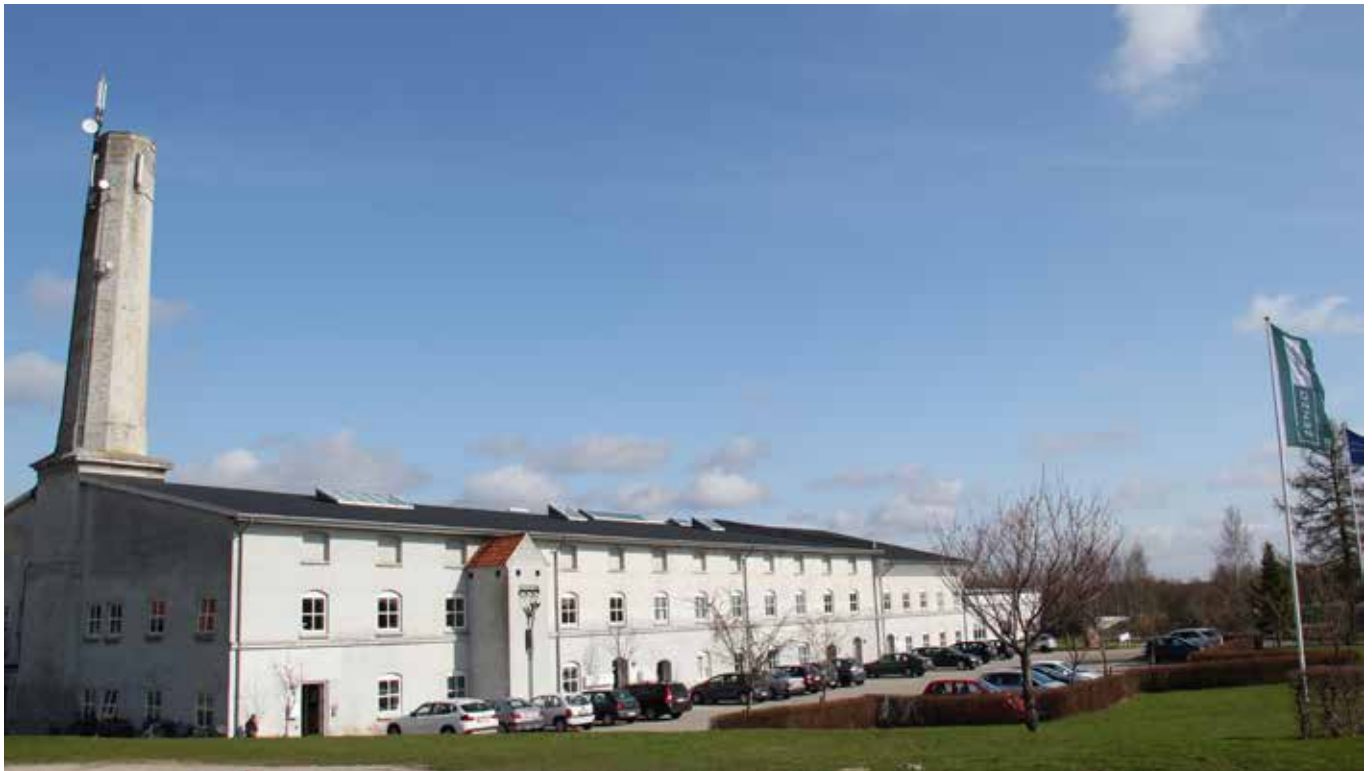
HOVEDKONTOR, ZENZO GROUP, DANMARK